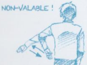
Touché en surface non valable de l'escrimeur à gauche de l'arbitre.