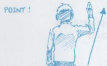
1 point pour l'escrimeur à droite de l'arbitre.