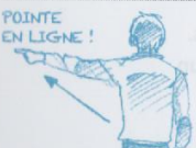
Position de pointe en ligne de la droite vers l'escrimeur de gauche.