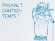
Parade ou contre-temps exécuté par l'escrimeur à droite de l'arbitre.