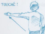
L'escrimeur à gauche de l'arbitre est déclaré touché.